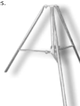
Trépied pour étais

Code 440033 Ø tube 26,9 mm, Hauteur 200 mm Code 440035 Ø tube 38 mm, Hauteur: 200 mm