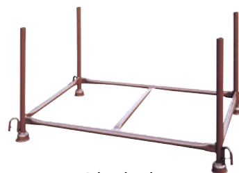
Palette de gerbage

Avec 4 crochets. Pour une utilisation universelle dans le domaine du stockage de produits longs. Tubes supports et longerons transversaux sont réalisés en tube rond: Ø 48,3 mm. Volume de remplissage: 1,43 m x 0,87 m x 0,70 m. Longeron central soudé supplémentaire. La palette peut supporter une charge allant jusqu'à 1,5 t. Transportable par chariot élévateur, chariot à fourche et grue. Les pieds en forme de tulipe permettent le gerbage des palettes de manière extrêmement stable. Volume de remplissage: 1,43 m x 0,87 m x 0,70 m Code 430030